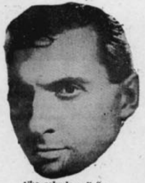
Çile çekmiş rejisör

Yurt gerçeklerine inmeye çalışan genç rejisörlerle Türk sineması yavaş ta olsa aydınlığa doğru gitmekte Sinema seyircisi iyi ve kötü fil ayırdetmekte küçümsenmeyecek gelişmeler kaydetti lerici rejisörlerin dayanışmaları ile bu gelişme daha çok hızlanacak v halk kimin kendisinden yana olduğunu yakın gelecekte anlayacaktır. Bu gelişme bazı sömürücü grupları bir hayli telaşa düşürmüş bulunuyor. Köprü başlarını tutanlar bu şuurlanmayı ve çalışmaları kösteklemek için ellerinden geleni yapıyorlar. Fakat sosyal gelişmenin önüne kimse set çekemeyecektir.