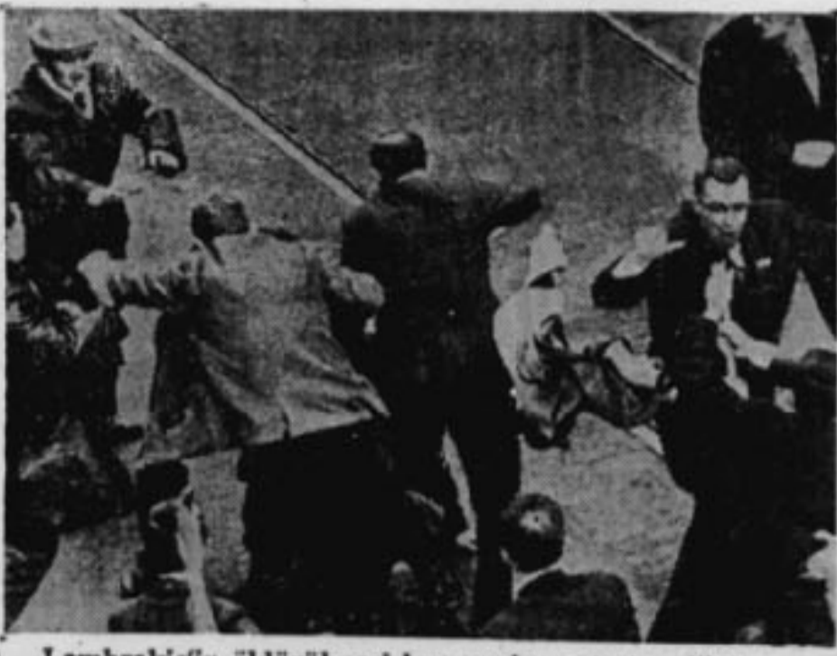
Lambrakis'in öldürülmesi her yerde protesto edildi ve nümayişlere sebep oldu