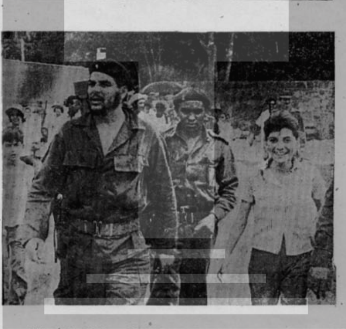
Küba İktisat Bakanı «Che» Gu avera bir devlet afluğunu geziyor — Amerika'lıların en çok kızdığı adam —