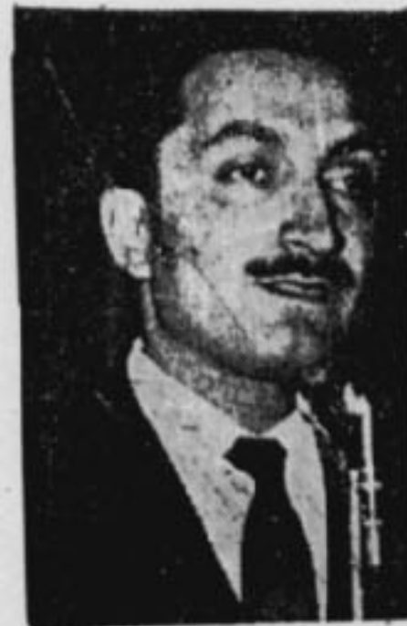
BÜLENT ECEVİT İş kazalarının çoğaldığını kabul etti

Uzmanlara göre; işverenler, işçi sağlığına ve iş emniyetine yeteri kadar önem vermiyor. Devlet sektöründe gösterilen titizlik ve dikkat kadar olsun özel sektörde iş emniyeti hiç gözetilmiyor. Çünkü aşırı kâr peşinde koşanlar, kolayca işçi bulabilmekteler. İşçisi bol, iş alanı dar olan memleketlerde böyle olur. Onun için emniyeti açısından işverenleri insan hayatına saygılı hâle getirecek sert, kanunî me-