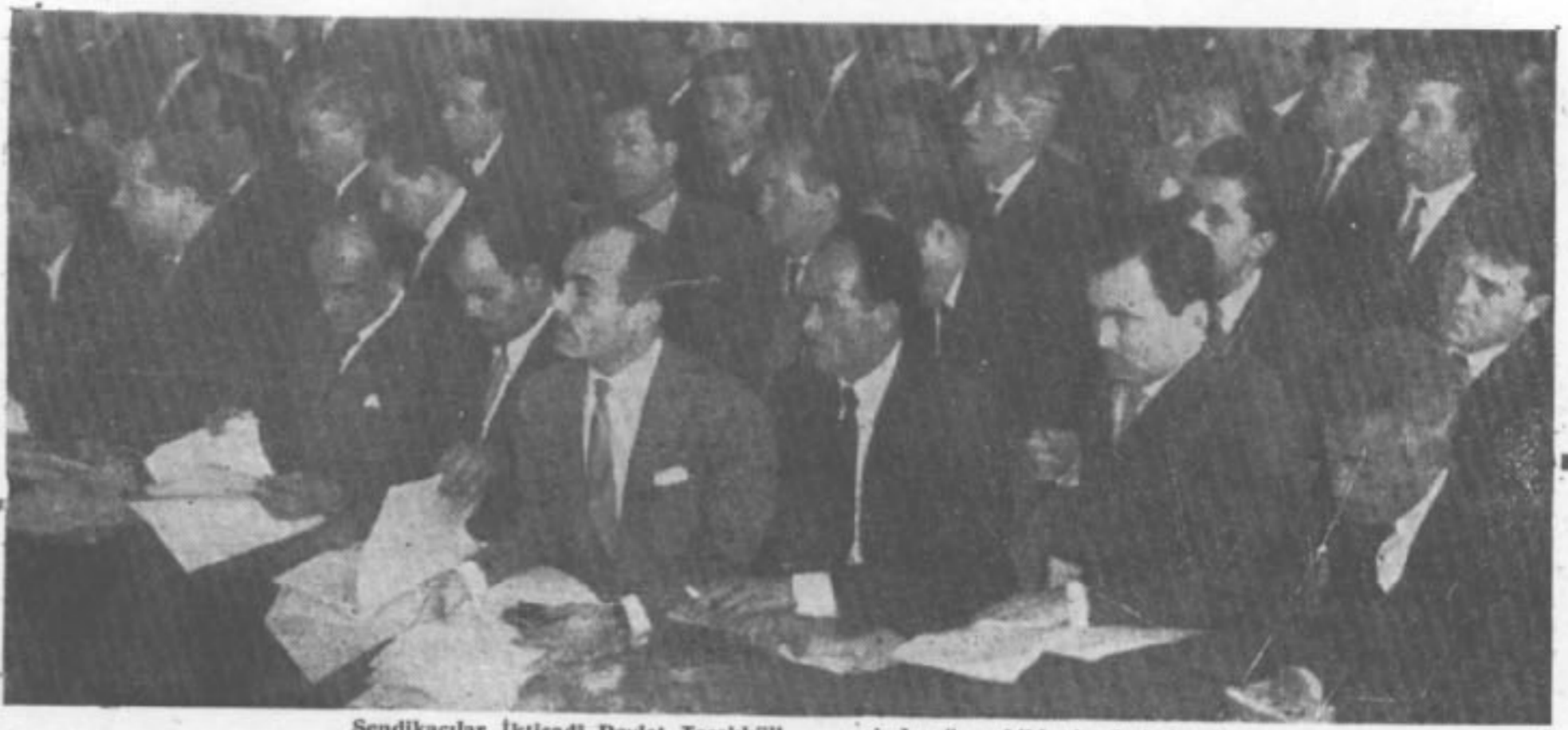
Sendikacılar İktisadi Devlet Teşekkülleri içinde söz sahibi olmak istiyorlar.

Reorganizasyon tasarısının ikinci maddesine göre İktisadi Devlet Teşekkülleri, sermayesinin yarısından fazlası devlete ait olan teşebbüslerdir. İştirak ise Devlet ve İktisadi Devlet Teşekküllerinin sermayelerinin yarısından azına sahip buldukları ve özel hukuk hükümlerine göre kurulan ortaklıklardır. Fakat reorganizasyon tasarısı o kadar eklenmiş ki, kendi koyduğu mantık ve tariflere uymak endişesini göstermez. Çünkü burada gaye devlet işletmelerinin tatbikatla meydana çıkan iki ana hastalığına çare bulmak değildir. Sadece 3460 sayılı kanunun boşluklarından istifade ederek yapılan işveren tasallutlarına mesru bir şekil